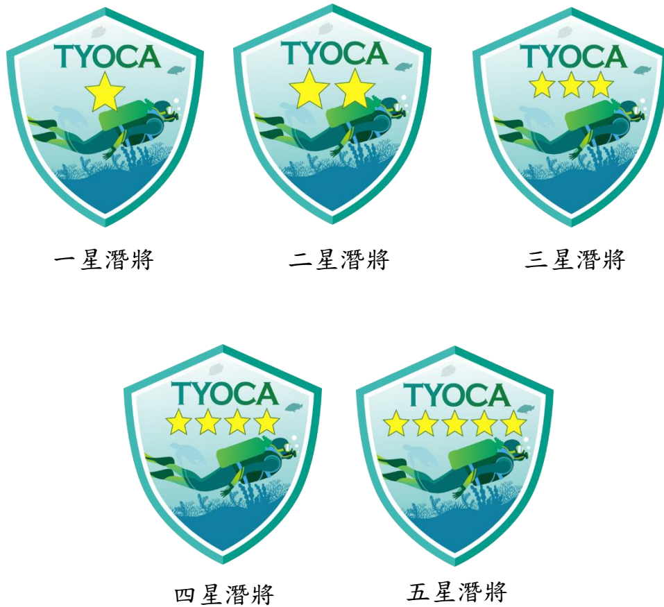
附件 5 桃園市環保潛水隊潛海戰將勳章示意說明表